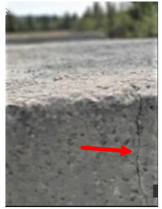
Indre bruplate før fornyelse. Gjennomgående sprekk på tvers av plata Sprekken over kanten Sprekk gjennom plata